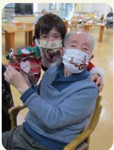
素敵なプレゼント もらえました!