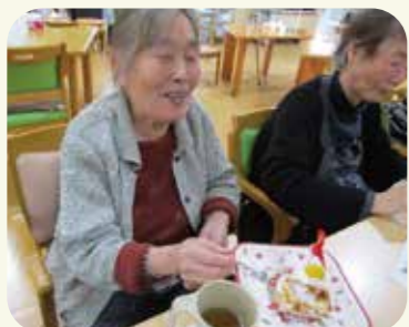
楽しく作れてよかったー!