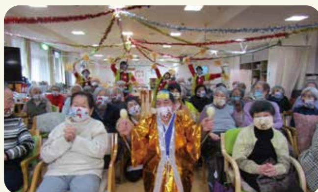
マツケンとハイチーズ!!