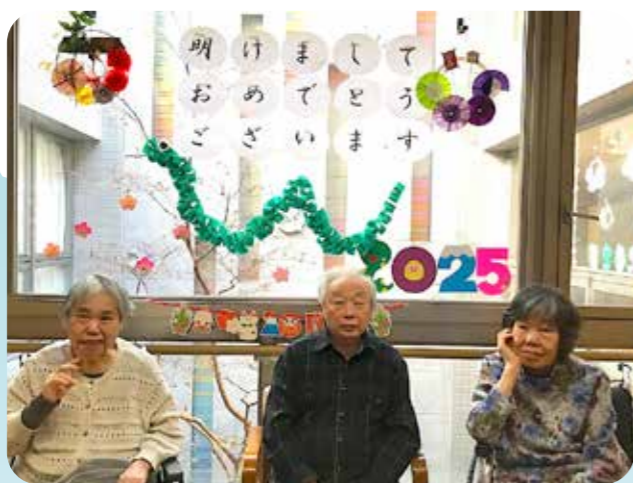
今年もよろしくお祈いします