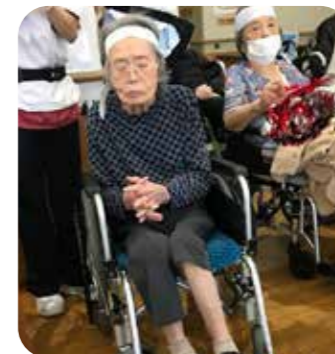
たくさん点取りたいな