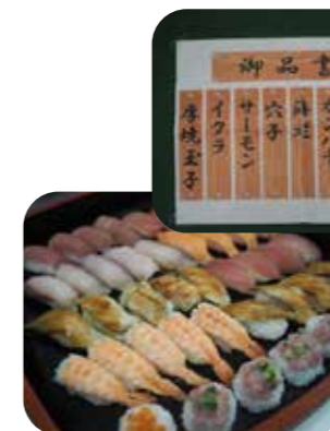
どれも美味しそう