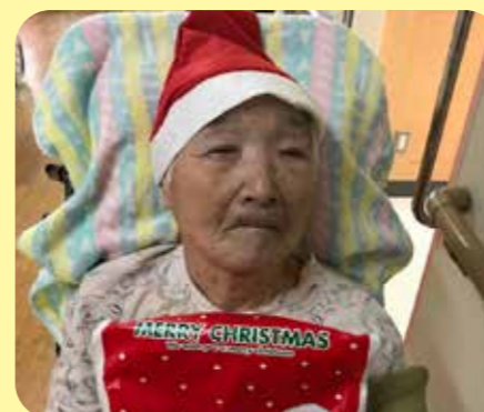
プレゼント貰ったよ!!