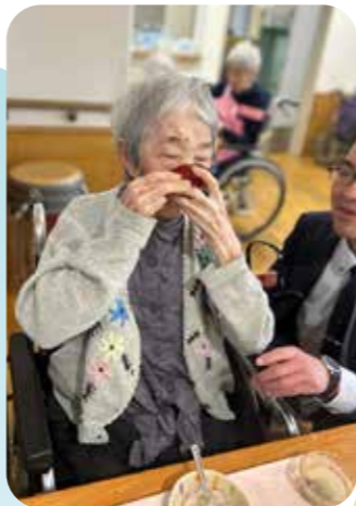
美味しい ゴククン!