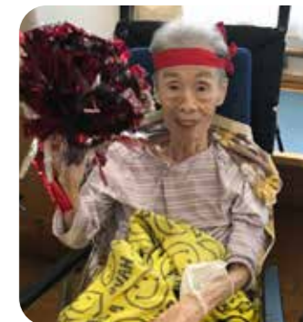
みんな頑張ってる