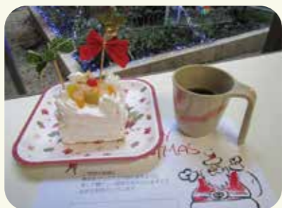
おいしいケーキが出来ました!!