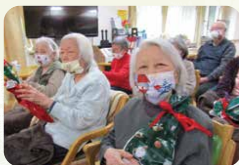
私ももらえました★