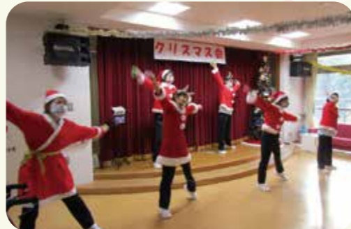
職員からダンスのプレゼント