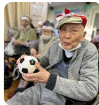
やる気スイッチオン!