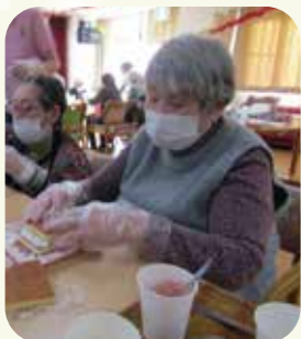
作るのが楽しいわ~