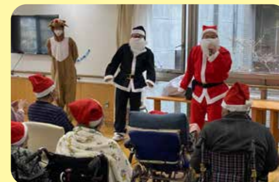
メリークリスマス!